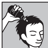
カロヤンアポジカΣプラス